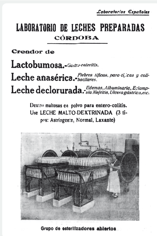
Imagen 1. Publicidad del "Laboratorio de leches preparadas" que aparece en el Boletín del Colegio de Médicos de Córdoba del año 1934.

A partir de 1924, la empresa pasó a denominarse Sociedad Gómez Aguado y Cía., nombre comercial al que se concede un registro de marca (nº 13018) en 1932 "para aplicarlo en las transacciones mercantiles de laboratorio de leches preparadas como Leche anasérica, Lactobumosa, Leche declorurada (de la que fue el primer elaborador en nuestra país), Leche Hipolactosada, Leche Malto-Dextrina, Leche malteada, Radioleum, Agua destilada, Leche Esterilizada, Lactomatal, Caseógeno (leche albuminosa en polvo), Extracto de malta y Caseocal." (Imagen 1).