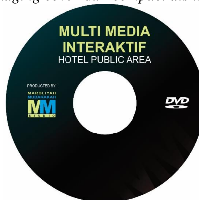
Gambar 3. Compact Disk Cover Multimedia Interaktif

Tahap terakhir adalah melakukan burning produk multimedia interaktif offline bilingual yang sudah dikatakan layak oleh ahli media dalam bentuk compact disk . Compact disk ini dapat digunakan pada semua tipe personal computer tanpa harus ada aplikasi tertentu. Pada gambar 16 di bawah ini merupakan cover compact disk dari produk multimedia interaktif offline bilingual dan gambar 17 merupakan packaging cover dari compact disk .