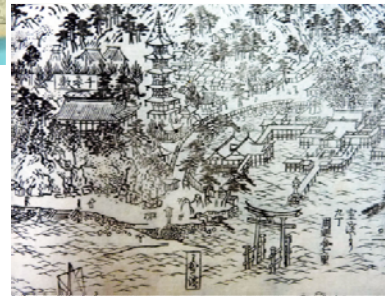
厳島神社全景図(一部)