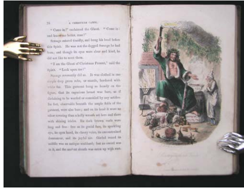
「クリスマス・キャロル」