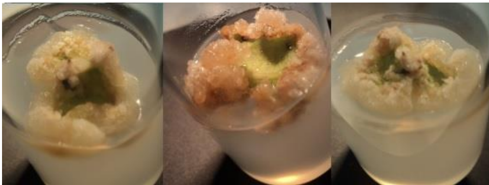
Figura 4: Explantes de Cissus verticillata (L.) Nicolson & C. E. Jarvis inoculados em meio contendo BAP, isoladamente.

A utilização de BAP isoladamente, em todas as concentrações, resultou em calos brancos e friáveis (Figura 4). Segundo George et al. (2008), a textura e morfologia do calo, manipulada pelas variações nos constituintes do meio nutritivo, produz calos macios, friáveis e úmidos, em meio de alta concentração de auxina e baixa de citocinina e se a relação é inversa, produz calos de tecido compacto seco e com células pequenas.