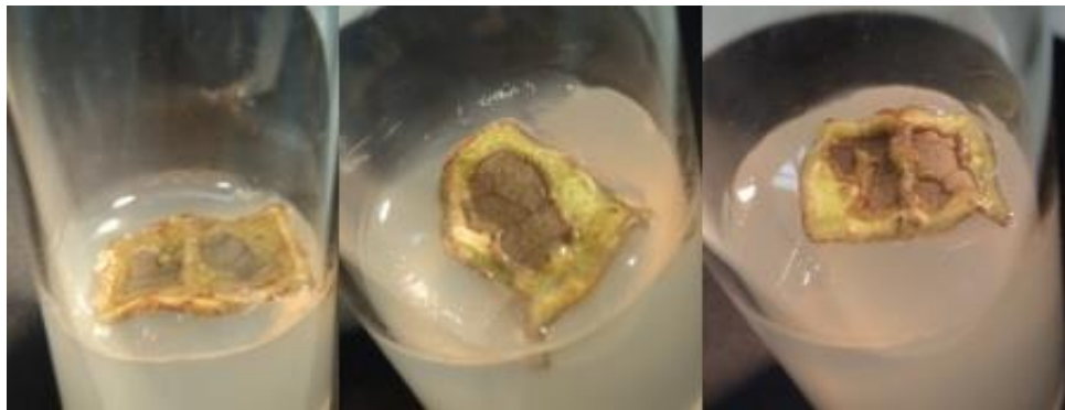
Figura 3: Explantes de Cissus verticillata (L.) Nicolson & C. E. Jarvis inoculados em meio contendo 2,4-D.

Aos sete dias após a inoculação, todas as concentrações de 2,4-D (0,0; 1,0; 2,0 e 4,0 mg.L -1 ) e BAP (0,0; 1,0; 2,0 e 4,0 mg.L -1 ) causaram intumescimento em 100% dos explantes, o que não foi observado no controle experimental. Porém, o 2,4-D apresentou efeito tóxico, causando necrose em todos os explantes, na região em contato com o meio (Figura 3). Foi observado que nos tratamentos em que não se utilizou este regulador de crescimento não ocorreu necrose, inclusive no controle experimental.