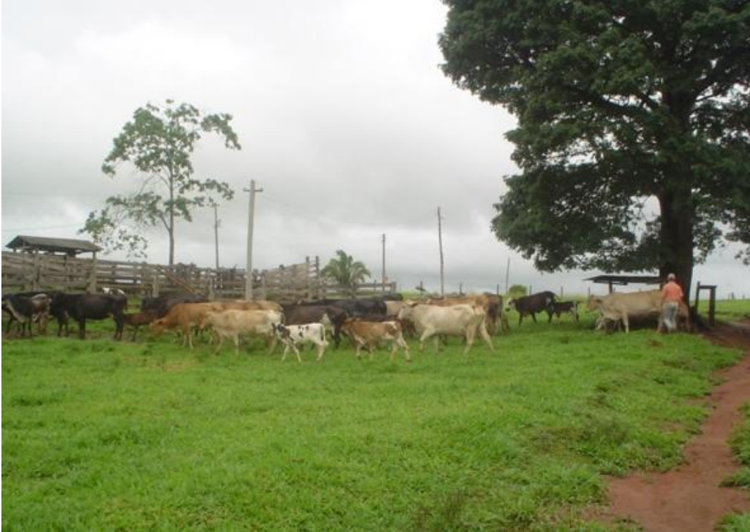
Figura 3: Criação de gado de uma das famílias pesquisadas.

3). Quanto às outras propriedades, uma produz cacau e a outra produz café, além de pequenas plantações para consumo próprio e outras criações (aves, suínos).