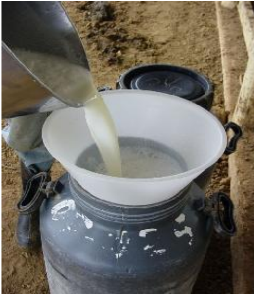
Figura 1: Etapa da ordenha manual.