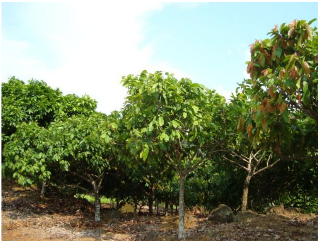
Figura 4: Lavoura de Cacao.