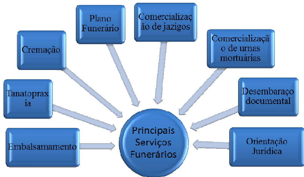
Figura 2: Principais serviços prestados pelas funerárias. Fonte: Funerária Best, (2016) adaptado.

E especificadas conforme apresentado na figura 3: