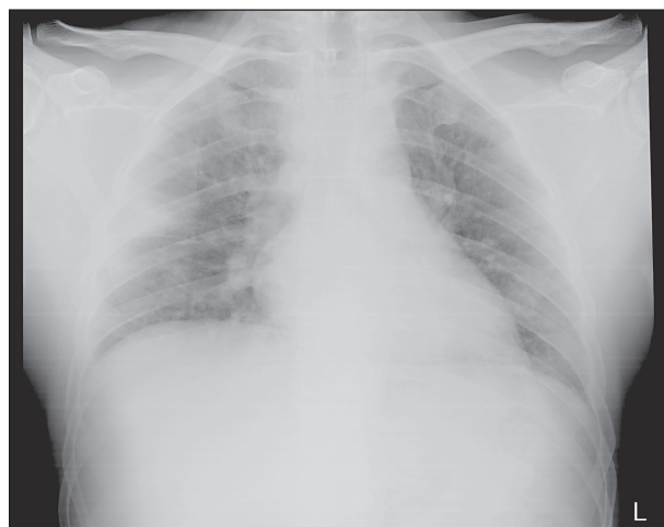
Sl. 1. RTG srca i pluća - difuzno smanjena prozračnost plućnog parenhima obostrano (retikulo-nodozni intersticij), naglašena vaskulatura te intenzivna sjena uz lateralnu torakalnu stijenku desno.

tersticij), naglašena vaskulatura te intenzivna sjena uz lateralnu torakalnu stijenku desno u bazalnim dijelovima gornjeg režnja. S obzirom na anamnestički podatak o zaduhu, i.v. primjeni drobljenih tableta metadona, rendgenskom nalazu srca i pluća uz visoke vrijednosti d-dimera učinjena je MSCT pulmonalna angiografija (sl. 2) koja je ukazala na embolus u lijevoj glavnoj grani plućne arterije te u lobarnoj grani za donji režanj desno uz periferne višestruke infarkte pluća. Bolesnik je pod dijagnozama plućne embolije, multiplih infarkta pluća i upale pluća zaprimljen u Jedinicu intenzivnog liječenja (JIL) Klinike za unutarnje bolesti.