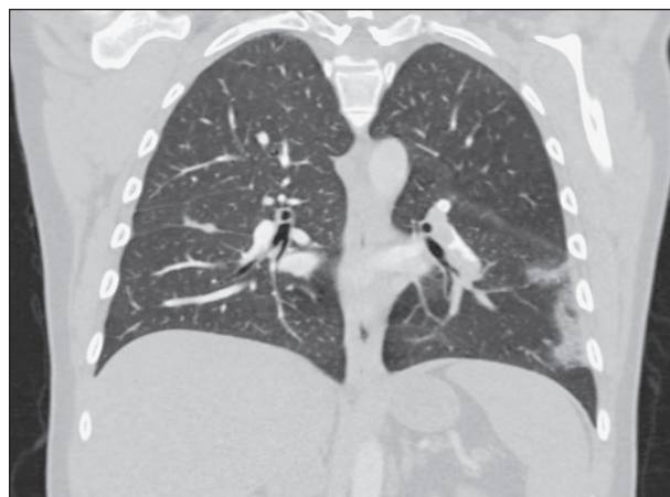
Sl. 2. MSCT plućna angiografija - embolus u lijevoj glavnoj grani arterije pulmonalis te u lobarnoj grani za donji režanj desno uz periferne multiple infarkte pluća

Kod prijma u JIL Klinike za unutarnje bolesti bolesnik je bio pri svijesti, orijentiran te urednih vitalnih pokazatelja uz blažu hipoksemiju (pO 2 8,69 kPa) u arterijskom acidobazičnom statusu. Vrijednosti prokalcitonina te kardioselektivnog biološkog pokazate-