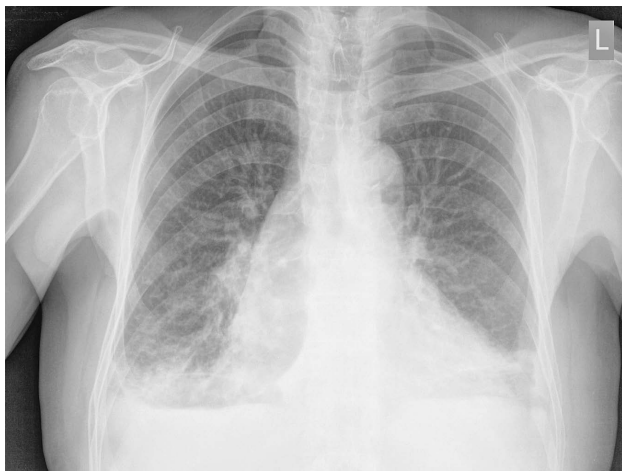
SLIKA 2. RADIOLOŠKI PRIKAZ OBOSTRANIH PLEURALNIH IZLJEVA FIGURE 2. CHEST X-RAY SHOWING BILATERAL PLEURAL EFFUSIONS