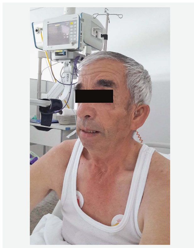
SLIKA 1. BOLESNIK S FENOTIPSKIM KARAKTERISTIKAMA TREACHER COLLINSOVA SINDROMA

73-godišnji muškarac primljen je na Odjel za unutarnje bolesti Opće županijske bolnice Vinkovci zbog zaduhe i edema potkoljenica. Anamnestički su podatci teško dobiveni jer je bolesnik od rođenja gluh. Heteroanamnestički nisu dobiveni relevantni podatci iz obi-