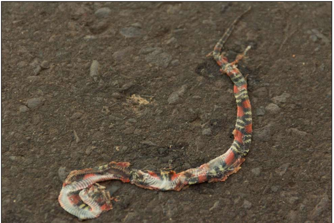
Figura 1. Ejemplar de Oxyrhopus guibei atropellado en la ruta nacional N° 9 Dr. Carlos Antonio López (Transchaco), Paraguay.

Comentarios — El género Oxyrhopus se encuentra representado en Paraguay por tres especies, O. guibei , O. petolarius y O. rhombifer (Cacciali et al. , 2016). O. guibei es una serpiente terrestre de hábitos nocturnos (Sazima y Abe, 1991) de porte mediano de la familia Dipsadidae (Xenodontinae: Pseudoboini), conocida comúnmente como falsa coral por presentar coloración y patrones que varían entre negro, rojo y blanco, al igual que las serpientes del género Micrurus o corales verdaderas. Su alimentación se basa principalmente en roedores y lagartos pequeños, y