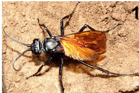
Figura 1. Hembra de Pepsis aciculata in vivo.

una capa de 10 cm. de tierra. En ellos, se construyó una cueva artificial contra el vidrio permitiendo observar el comportamiento de la araña dentro de la cueva. Las experiencias comenzaron el 20-II-2011 y consistieron en la liberación de la hembra de P. aciculata en cada una de los recipientes y observar su comportamiento. Si en 30 min. no se observó ningún ataque, se consideró finalizada la experiencia. Si ocurría el ataque, la observación continuó hasta que la araña fue enterrada. Luego, se procedió a una cuidadosa excavación para retirar la araña inmovilizada y se la colocó en un recipiente artificial con tierra para permitir su observación.