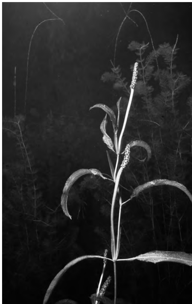
Figura 2. Potamogeton lucens , Estanho d'Escunhau.

MARESME: Tordera. Bassa petita a la ribera del riu Tordera, prop del poble homònim, DG7415, 30 m (Margalef-Mir, 1981). Diversos plecs de 1979-1980, que suposem corresponen a un mateix lloc. Balsa del Tordera, 1979, Margalef-Mir (BC 674985, 674986, 674987); estanyols del Tordera, 1980,