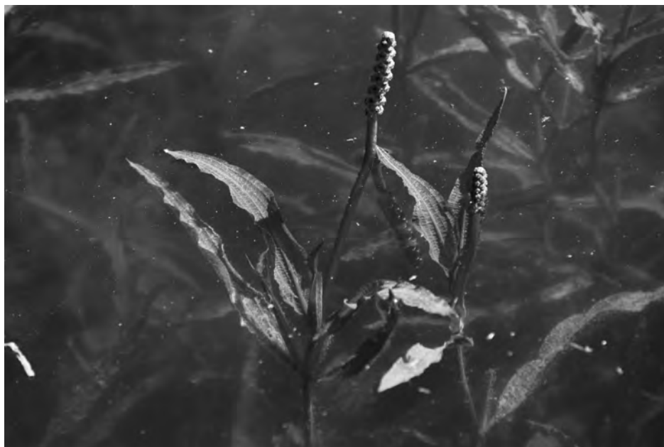
Figura 3. Potamogeton schweinfurthii , bassa de Sanavastre.

estany immediat a l'Empalme, 17-V-1909, J. Cadevall (BC 823485); Empalme, 19-V-1909, J. Codina (BC 638745, BCN 3303). No tenim constància que a partir de l'inici del segle XX l'espècie hagi estat citada de la zona, que ha estat molt transformada, i l'estanyol en el qual creixia hauria desaparegut; en visites recents a aquest sector no s'ha localitzat P. lucens .