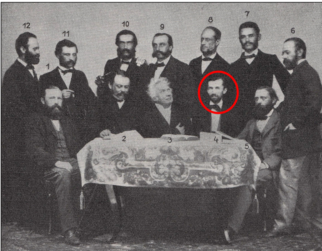
Figure 6. A photograph of the founders of the Natural Science Society at Brünn in 1862. Number 4, encircled, is Johann Nave. Number 10 is Gustav Niessl von Mayendorf.