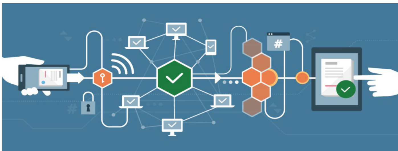
Fig. 1. Blockchain

ne son realmente públicos y fácilmente verificables (Rosic, 2017). No existe una versión centralizada de esta información. Por lo que la cadena de bloques es inmutable, así que en teoría nadie puede manipular los datos que están dentro de la cadena de bloques.