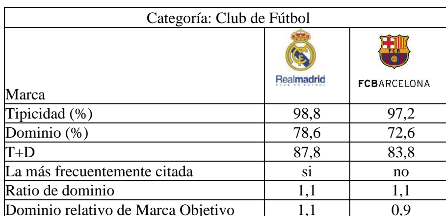
Tabla 2. Análisis de tipicidad y dominio de las principales Marcas de club de Fútbol

La marca de Real Madrid fue la marca más frecuentemente mencionada dentro de la categoría de club de fútbol, y fue mencionada 1,1 veces más que la segunda marca más mencionada, en este caso, Fútbol Club Barcelona. Finalmente, la fila 7 recoge el dominio relativo de la marca objeto de análisis respecto a la marca más citada o si ésta es la más citada, respecto a la segunda. Para aquellas marcas objetivo más citadas, esta fila es idéntica a la fila anterior. De los resultados se desprende que la tipicidad excede al valor del dominio de marca.