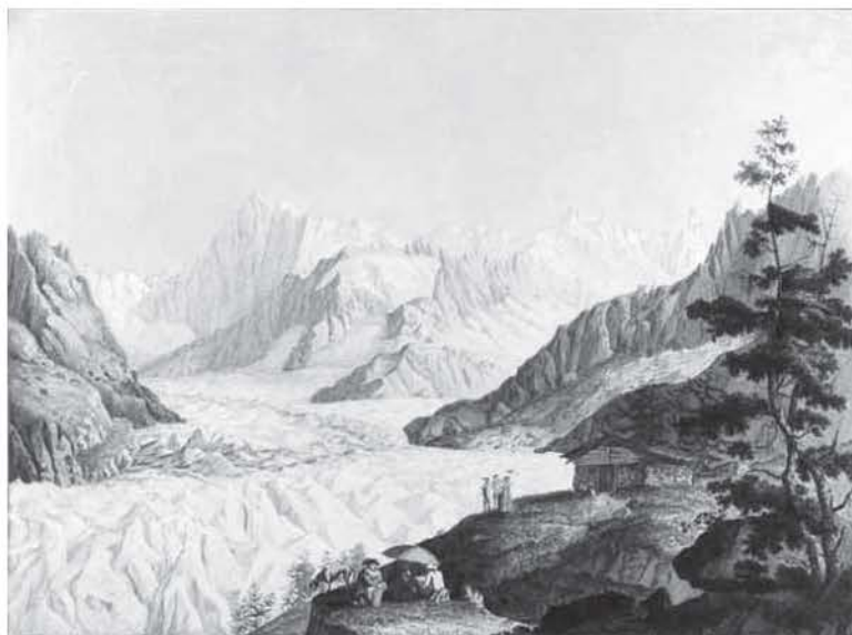
Figura 3. Carl Hackert: Vue de la Mer de Glace et de l'hospital de Blair du sommet du Montenvert dans le mois d'Aoust 1781, 1781 . Grabado coloreado a la acuarela, 345 x 465. Annecy, collection Paul Payot.