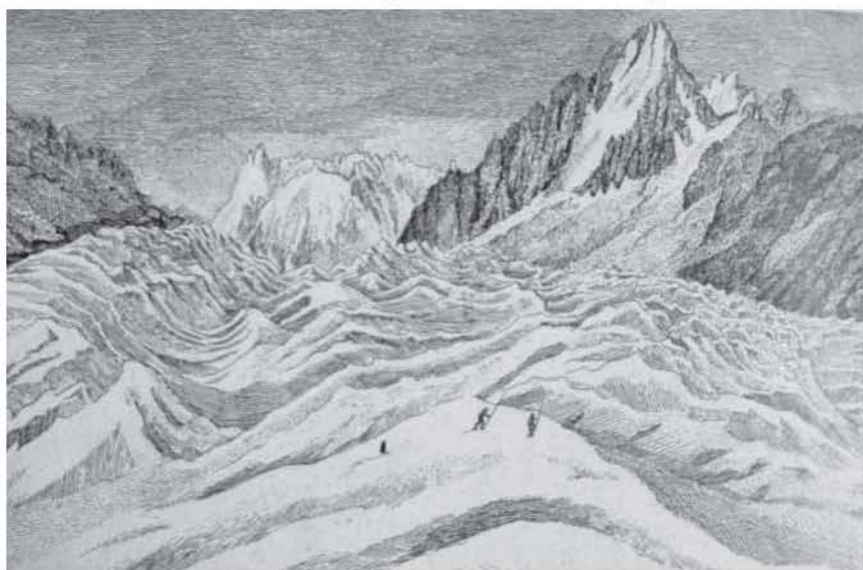
Figura 4. M. T. Bourrit: Vue de la mer de glace du Montenvert, 1787 . Grabado, 85 x 138. Annecy, collection Paul Payot.