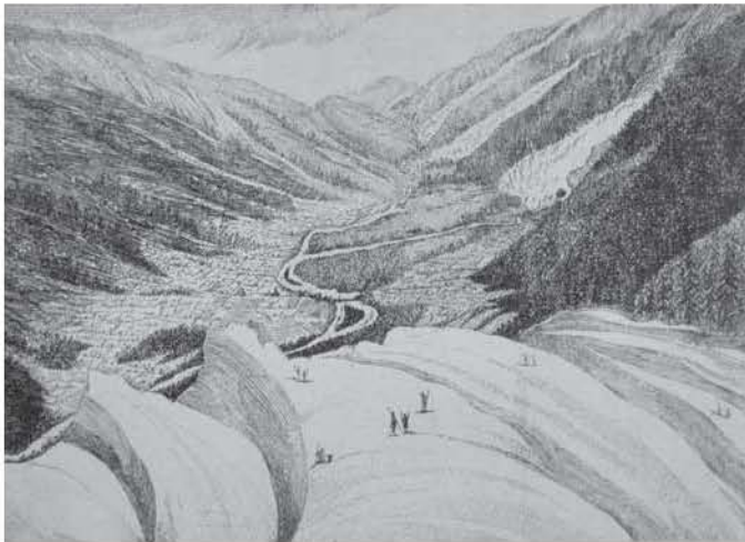
Figura 2. M. T. Bourrit: Vue de la vallée de Chamouni de dessus le glacier des Bossons , 1773. Gravure, 96 x 125. Annecy, collection Paul Payot.