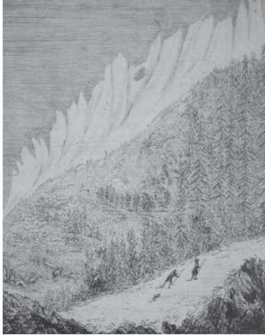
Figura 1. M. T. Bourrit: Mur de Glace pure du Glacier des Bossons , 1773. Grabado, 126 x 98. Annecy, collection Paul Payot.

que se llamaba lo sublime y que representaba el último reducto de una experiencia estética surgida de la naturaleza más salvaje, puesta ahora al servicio del viajero.