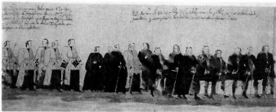
Fig. 3. Provisor del Arzobispo y sacristanes en el Congres de Sevilla