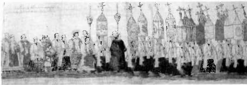
Fig. 2. Cruces de las Parroquias en el Corpus de Sevilla