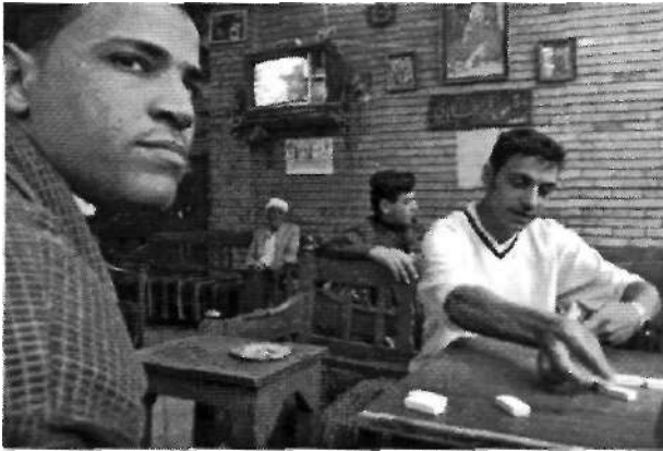
24 de marzo del 2003 Ciudadanos iraquíes juegan al dominó mientras escuchan a Saddam en un café en el centro de Bagdad. Time, com

La asociación semiótica de la fotografía número cinco es la de una escena de vida cotidiana tranquila pero interrumpida por el fotógrafo. Estamos viendo el interior de un café, dónde unos jóvenes juegan al parchís con un televisor de fondo. La escena es interrumpida por la mirada /llegada del fotógrafo. Esa interrupción nos es mostrada por la expresión del joven que mira fuera del marco, hacia el receptor. Aquí los editores nos tienen que matizar que estamos viendo a gente que están escuchando a Saddam Hussein en un café. Pero los signos nos muestra una escucha desatenta mientras que la atención se centra sobre la interrupción/ llegada del extraño a la escena.