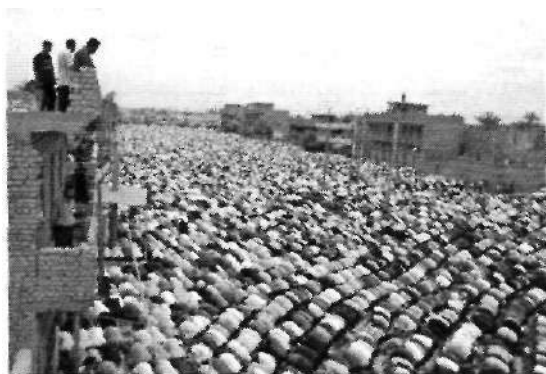
18 de abril del 2003 Miles de shitas de Bagdad se reúnen para la oración del viernes en la ciudad de Saddam.

A guisa de conclusión incluimos la vigésima primera fotografía del corpus, la última también en el reportaje de Yuri Kozyrev, que representa a miles de emitas orando en la ciudad de Sadam. Con esta comunicación quisimos ilustrar como el uso del lenguaje de la fotografía sirvió para que, ya fuesen los fotógrafos, los editores o los comandos militares, pudieran esquivar la censura militar y política durante la guerra de Irak. Estas fotografías muestran una visión crítica de la guerra. Esta visión negativa se consideraría como una traición anti-norteamericana y por lo tanto, de acuerdo con el fundamentalismo norteamericano, pro-terrorista, si se hubiese presentado en el lenguaje hablado o escrito en los medios de comunicación en que fueron reproducidos.