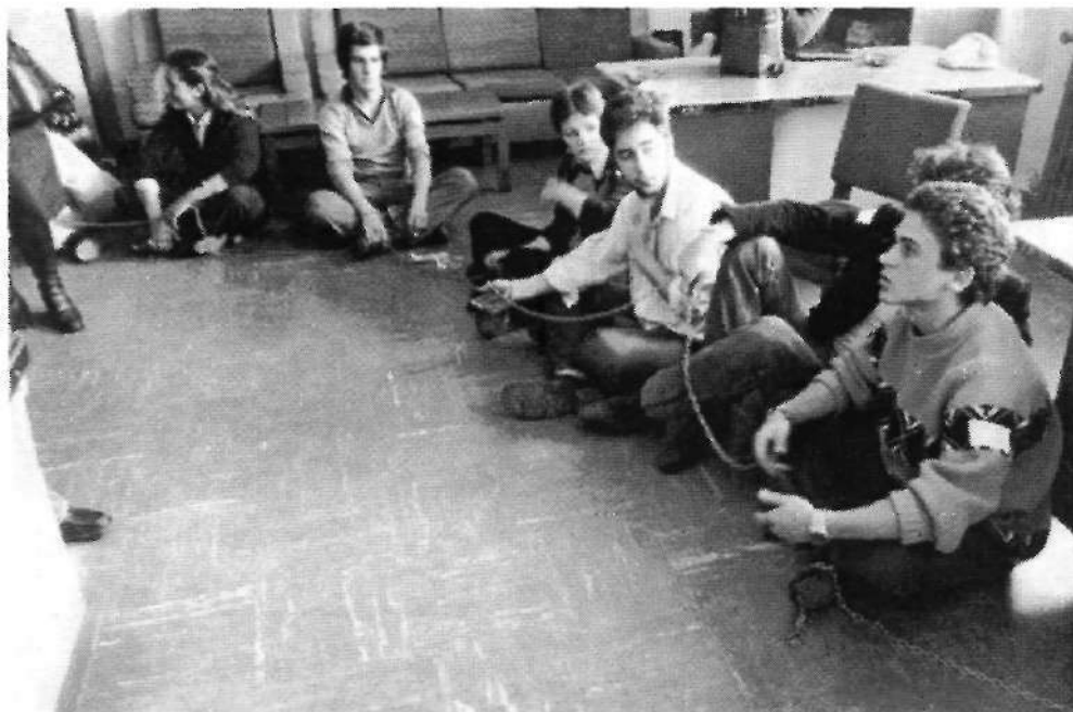
Foto nº 7: Encierro de representantes en el Hospital Provincial. Año 1975.

F 208-1.