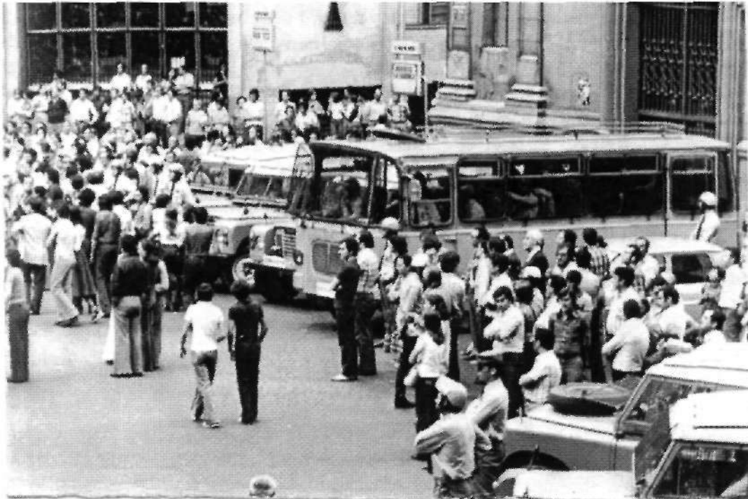
Foto nº 5: Concentración de trabajadores frente a la sede del Sindicato Vertical en Valladolid. Año 1975 Archivo Municipal de Valladolid. F 580-14.

El aparato de la Organización Sindical se aplicó desde los primeros momentos en llevar a cabo una campaña destinada a vender la imagen de un sindicato benefactor y a resaltar la categoría humana y los valores de los candidatos propios frente a la oposición para cuyo descrédito aconsejaba la utilización de instrumentos que debilitaran su imagen. Además de seguir esta estrategia, difundió una serie de reivindicaciones que se centraban en plantear la regulación de conflictos laborales, consecución del equilibrio entre precios y salarios, reforma de la empresa, modificación del tope del impuesto del rendimiento del trabajo personal de los trabajadores, reducción de la jornada de trabajo con carácter general, mejora del régimen de garantías sindicales, etc. 20 . Sin embargo, pese a hacer una defensa férrea de su sindicato incluso en las calles como se observa en la fotografía nº 6, lo cierto es que se tuvo que enfrentar a las estrategias de las diferentes organizaciones que, pese a ser la mayor parte de ellas clandestinas, desplegaban toda su fuerza con el fin de conseguir sus objetivos.