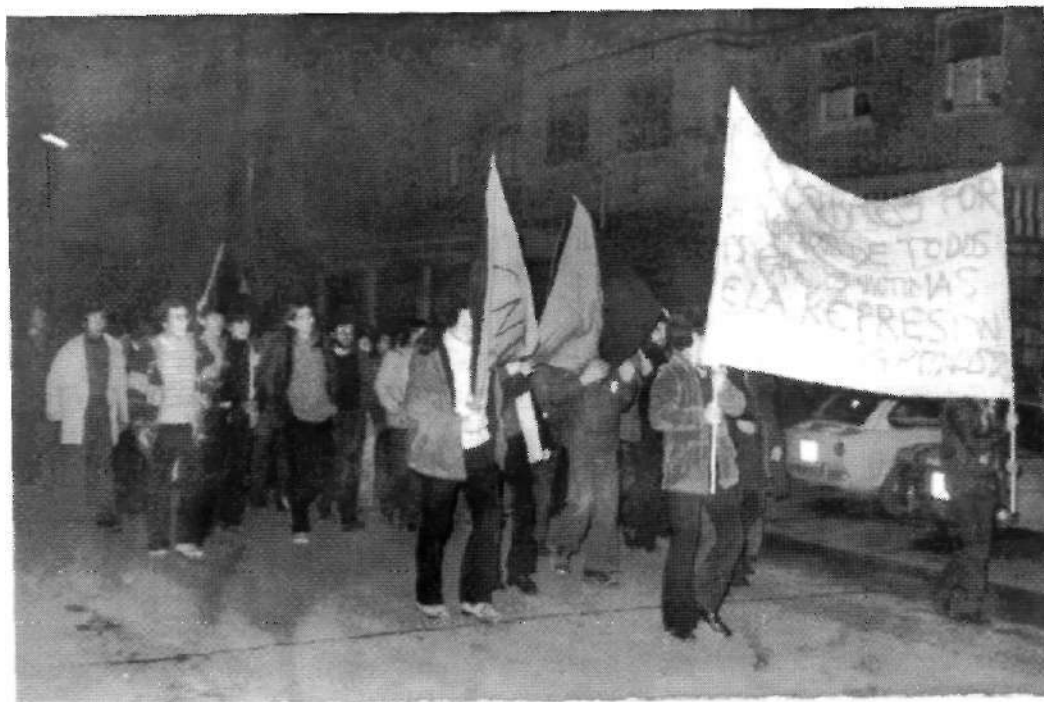
Foto n° 2: Manifestación reivindicando la libertad de los presos políticos. Año 1975. Archivo Municipal de Valladolid. F 580-28.

Se trataba, pues, de dos sensibilidades distintas frente a una misma realidad que aceleró su desmantelamiento con la desaparición física del artífice de este régimen político. Es este sentido, se entiende el comportamiento adoptado por la clase política de la ciudad en los primeros momentos que siguieron a la muerte de Franco, pues todos sus actos invitan a pensar que seguía sumida en un régimen político imposible de sobrevivir al dictador recién fallecido. Efectivamente, nada más conocer la noticia de