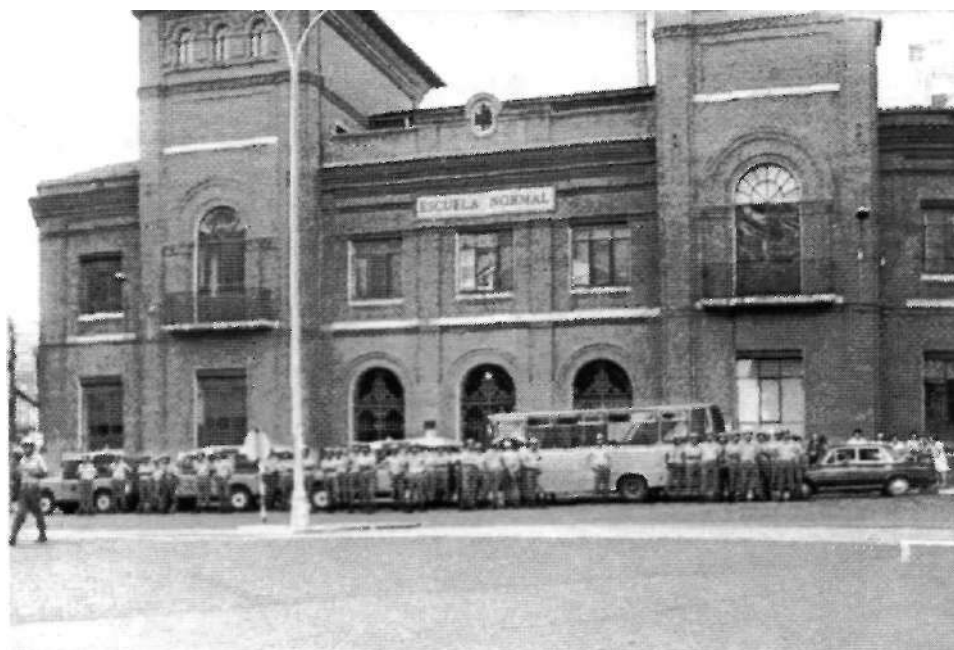
Foto n° 4: Policía Armada preparada para hacer frente a manifestaciones públicas en la Plaza de España. Año 1975.

F 583-5.