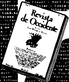
Primer número de la Revista de Occidente, fundado por José Ortega y Gasset en 1923

En sus más de sesenta años de vida, la Revista de Occidente ha contado con las colaboraciones de los más prestigiosos firmas del presente siglo. Continuando esa magnífica tradición cultural, la Fundación José Ortega y Gasset ha realizado un esfuerzo editorial extraordinario para aumentar la frecuencia anual de la Revista de Occidente. A partir de ahora, nuestra publicación aparecerá todos los meses para que Ud. pueda enriquecer su colección.