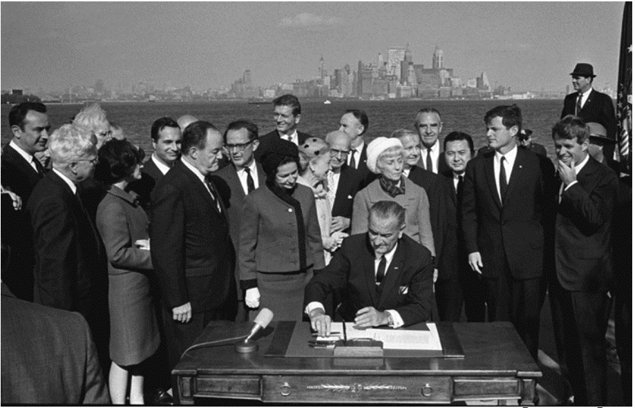
अमेरिका के इतिहास में सबसे दुखद दिन। राष्ट्रपति जॉनसन, 2 कैनेडी और पूर्व राष्ट्रपति हवर के साथ, मेक्सिको के लिए अमेरिका देता है - अक्टूबर 3rd 1965