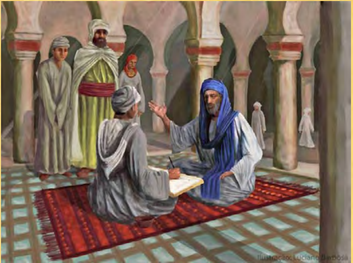
Ilustração que representa Ibn Battuta narrando suas viagens ao poeta Ibn Djuzzay, em 1356, que as registrou.

crítico os padrões culturais, políticos, sociais e econômicos postos em conexão durante a viagem, permite falar tanto do mundo do viajante quanto do mundo por ele observado.