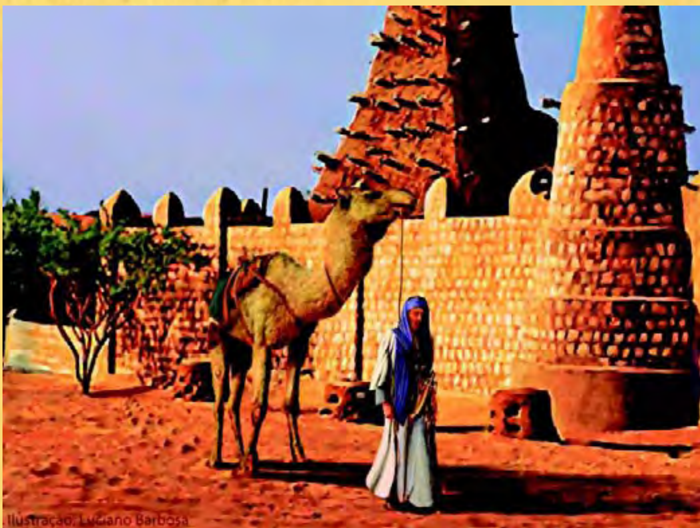
Ilustração: Luciano Barbosa

africana cuja trama se perdeu em nossa memória, obscurecida e minimizada pela angustiante lembrança da escravidão. A insistência na história desses poderosos Estados postos em ligação durante séculos pelas rotas comerciais do Saara tem uma finalidade didático-pedagógica imediata: desmistificar o estereótipo que associa diretamente todo aquele imenso continente com tambores, máscaras e tribos. Além disso, trata-se de tornar familiar para nós o extraordinário papel civilizatório do Islã e da cultura muçulmana na África.