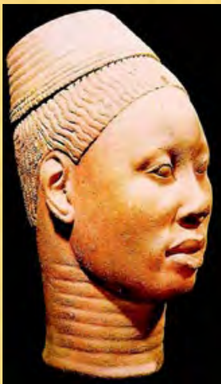
Escultura em terracota datada dos séculos XII - XIV, encontrada em Oni, Ife (Museu das Antiguidades de Ife)

Todo o material será divulgado oportunamente pelo SECAD-MEC para as escolas públicas brasileiras, e o site será hospedado no portal Domínio Público .