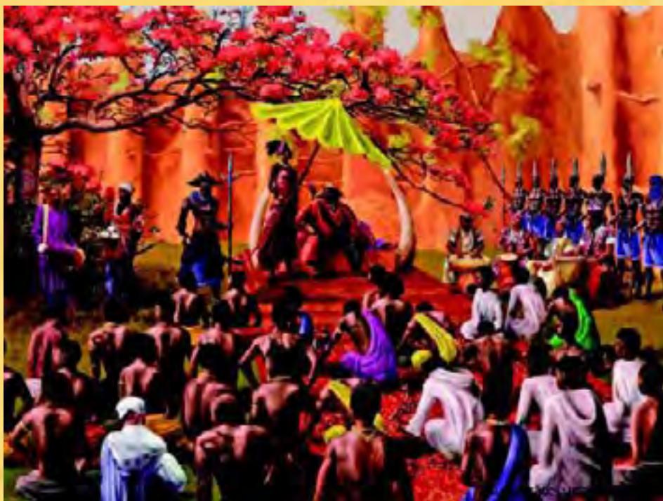
Audiência pública com o Mansa (rei) do Mali quando da viagem de Ibn Battuta