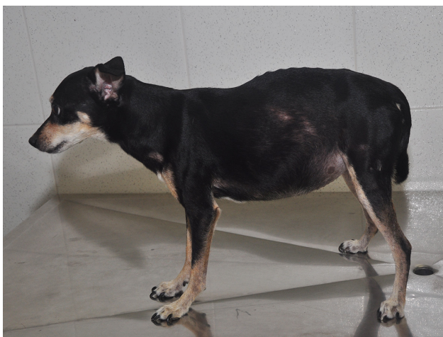
Figura 1. Canino, Pinscher, 13 anos de idade apresentando distensão abdominal devido a presença de líquido livre abdominal e colangiocarcinoma hepático difuso.

Foi atendido no Hospital de Clínicas Veterinárias (HCV) - Universidade Federal do Rio Grande do Sul (UFRGS), um canino, fêmea, da raça Pinscher com 13 anos de idade e 6,7 kg, apresentando histórico de distensão e desconforto abdominal associado a dispnéia há 1 mês (Figura 1). O animal já havia sido submetido a mastectomia unilateral total para remo-