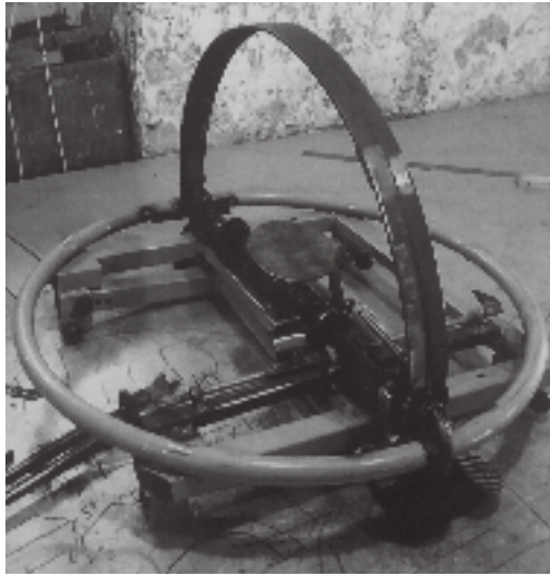
Figura 1 · Laura Cattani e Ío: Demônio Pessoal . Escultura em metal e vidro (2015).