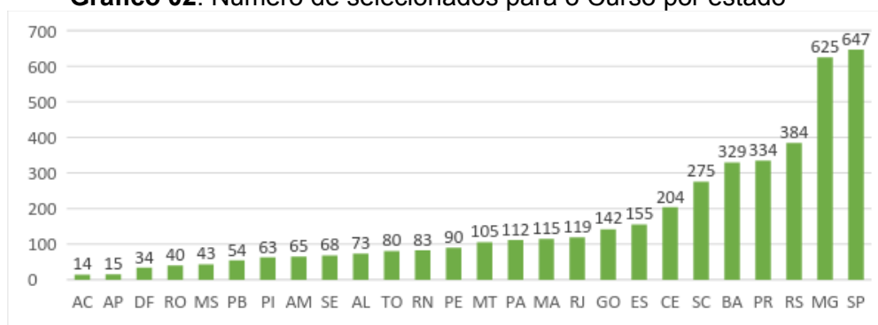
Gráfico 02: Número de selecionados para o Curso por estado

Os interessados no curso representaram 25 unidades federativas. Tiveram maior número de participantes os estados São Paulo, Minas Gerais e Rio Grande do Sul, como pode ser percebido no Gráfico 02 de acordo com o número de selecionados para o curso por estado. As regiões sudeste, nordeste e sul têm significativa participação, correspondendo respectivamente a 1.527(36%), 1.060 (25%) e 1.018 (24)% dos cursistas. Enquanto isso, os participantes das regiões Centro-Oeste e Norte correspondem a 340 (8%), 297 (7%), respectivamente.