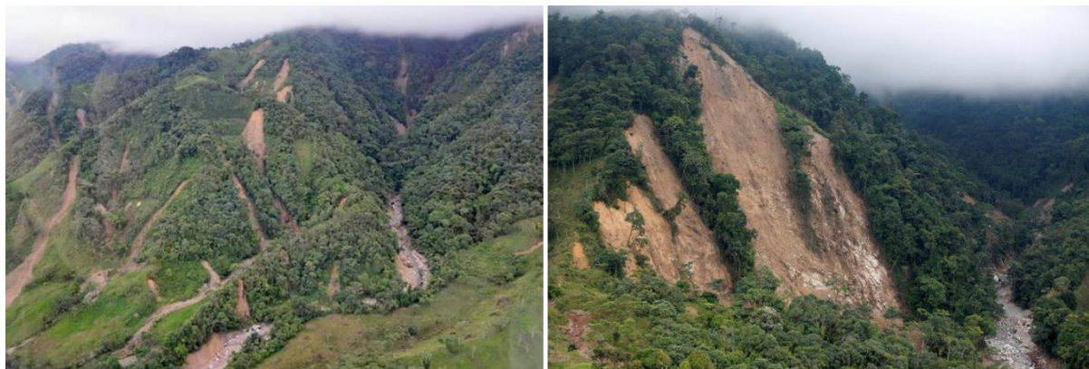
Figura 2 – Escorregamentos translacionais na bacia do rio Mocoa

mobilidade de escorregamentos na encosta até alcançarem a calha do rio. A Figura 2 mostra os diferentes escorregamentos translacionais que aconteceram na área de estudo, ao exibirem uma superfície de ruptura de geometria plana, além de como alguns desses escorregamentos atingiram os cursos de água.