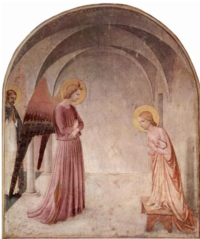
Fra Angelico , Anunciação, c. 1440-41. Afresco, Florença, Convento de San Marco, cela 3

Didi-Huberman, em seu livro "Diante da Imagem" (2013), no capítulo intitulado "A história da arte nos limites da sua simples prática", inicia seu texto apresentando o afresco "Anunciação", feito por Fra Angelico (1387-1455), datado provavelmente do ano de 1440, localizado em uma espécie de cela de clausura do pintor. A imagem apresenta um espaço aparentemente simples, onde a Virgem recebe, de um anjo, o anúncio do nascimento de Jesus e de sua incumbência de lhe dar a luz. O afresco não apresenta muitos detalhes e suas figuras são estáticas.