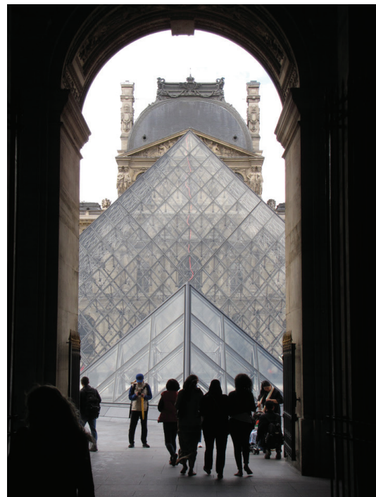
Figura 4. Vista da Pirâmide através da passagem em uma ala do Museu.

A qualidade estética da relação da Pirâmide com o Louvre clássico também pode ser constatada durante