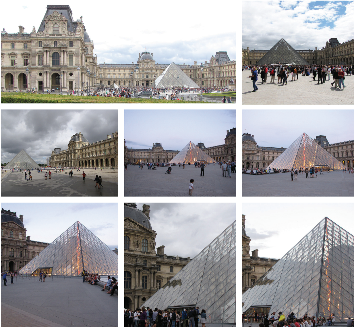
Figura 1. Pirâmide do 'Le Grand Louvre'. Figure 1. 'Le Grand Louvre' Pyramid.

características físicas da composição arquitetônica, de sua estrutura formal, da percepção visual dos estímulos gerados por tais características como consequência de processos fisiológicos (Weber, 1995). Por outro lado, a estética simbólica trata do conteúdo ou significado da estrutura, das associações simbólicas proporcionadas por tal estrutura, pelo uso da edificação e/ou por sua história, como resultado do processo de cognição que inclui aspectos tais como memórias e valores. Estas duas abordagens fazem parte da estética empírica que considera que é possível haver reações estéticas idênticas ou similares, por parte de diferentes pessoas, para determinada composição arquitetônica (Lang, 1987). Assim, para a estética empírica a beleza está mais no objeto percebido do que nos olhos