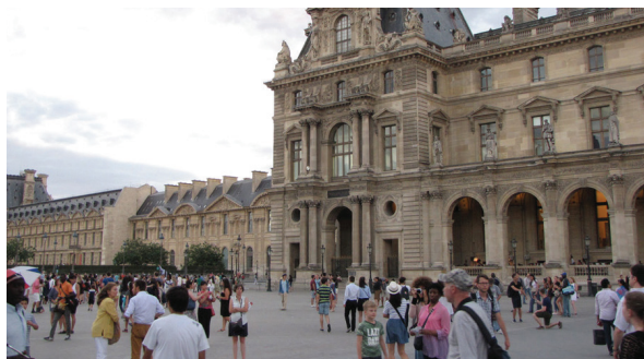
Figura 3. Vistas do Museu do Louvre sem a Pirâmide na 'Cour Napoléon'. Figure 3. Views of the Louvre without the Pyramid in 'Cour Napoléon'.