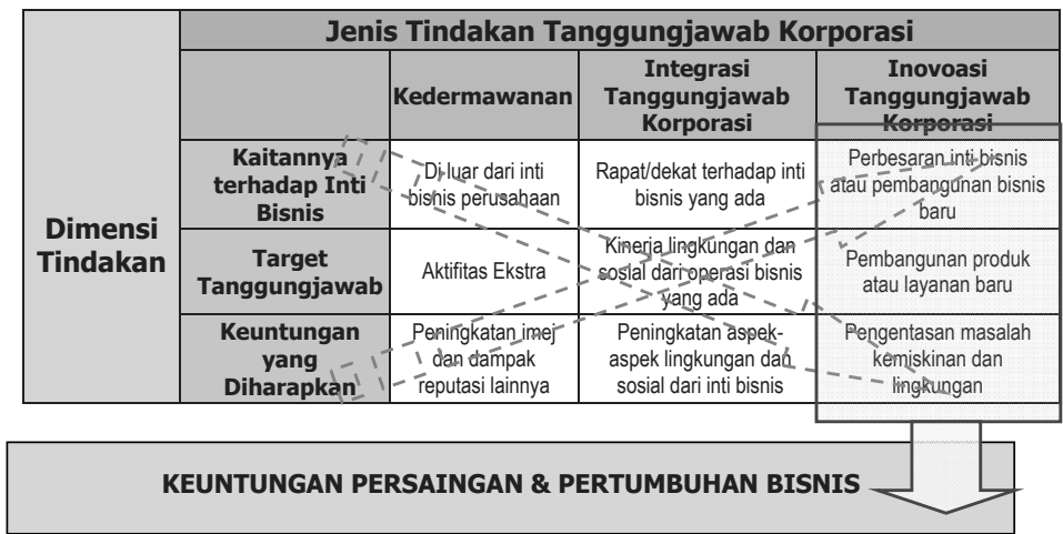
Gambar 1. Hasil dari Tindakan Perusahaan dengan Tanggungjawab Sosial Terhadap Inovasi (sumber: Sihombing & Suprpto (2008) yang diadaptasi dari Halme (2007))

1). Dengan menangani masalah pengentasan kemiskinan dan lingkungan, maka hasil dari inovasi produk yang dibuat pada gilirannya akan membangun pertumbuhan ekonomi secara bersama (Halme, 2007).