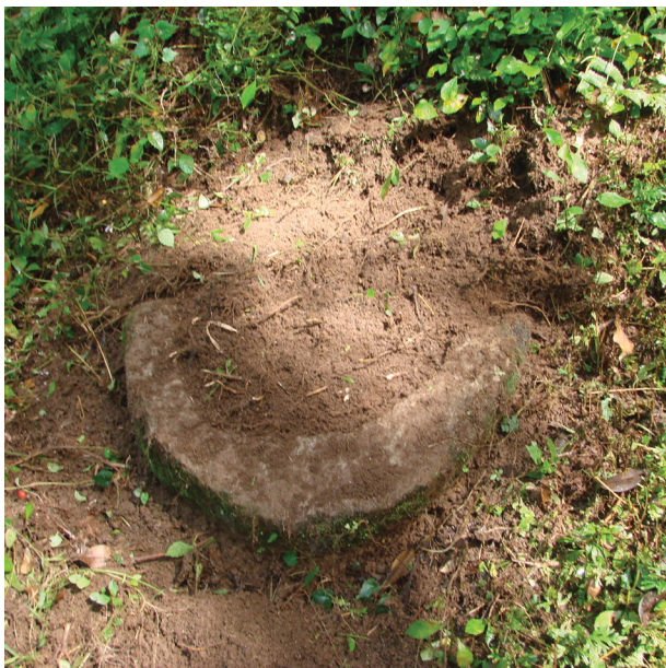
Gambar 3. Temuan Sarkofagus di Situs Susutan.

di tegalan kebun. Sarkofagus di Situs Susutan memiliki hiasan berupa tonjolan berbentuk bulat (gambar 3).