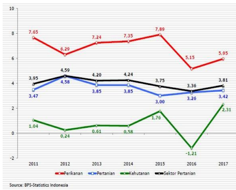
Gambar 3. Grafik Produktivitas Ikan Nasional