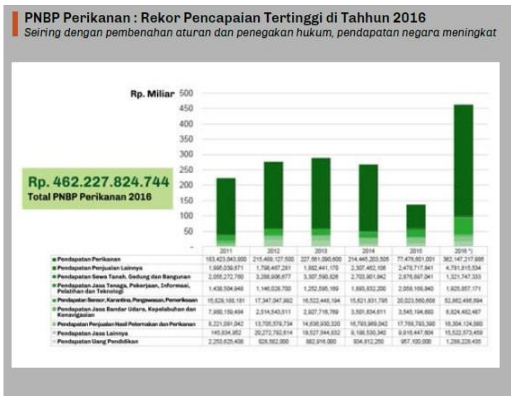
Gambar 2. Produktifitas Hasil Ikan Indonesia