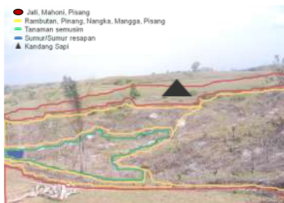
Figure 2. Agroforestry design at critical land based on landscape

bukit, tanaman MPTs dan tanaman tahunan lebih diarahkan pada daerah lereng dan lembah, sedangkan untuk tanaman semusim/palawija lebih baik ditanam pada bahagian lembah.