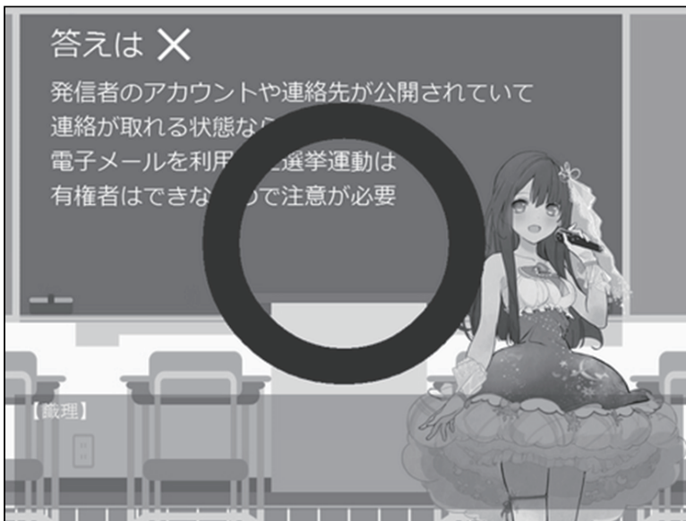
図3 理解度チェック解答表示画面の一例