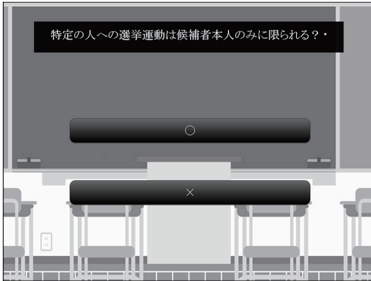
図2 理解度チェック選択画面の一例

学習者に対して、以下の3点について、図2のように○×の2択で考えさせ、ボタンを選択させる。(1) 18歳以上の有権者であれば選挙運動ができる：正解は○。(2) 特定の人への選挙運動は候補者本人のみに限られる：正解は×。(3) ネットやSNSを使った選挙運動は認められない：正解は×。それぞれの設問に対して、図3のように学習者が選択した回答に対する正解・不正解を明確に表示し、解説を表示する。また3問終了後に、学習者の回答と正答を比較して表示し、誤った箇所を明確に表示する。