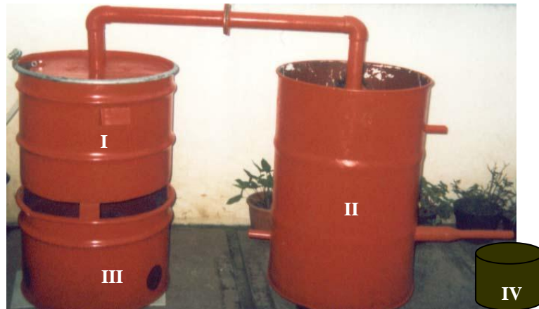
Gambar 1. Reaktor pirolisis sederhana