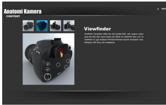
Gambar 5. Penjelasan Bagian Kamera