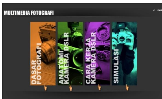
Gambar 2. Halaman Utama

Pada halaman utama menampilkan sebuah tampilan sederhana yang berisi empat konten, yaitu: (1) dasar fotografi, (2) anatomi kamera DSLR, (3) cara kerja kamera DSLR, dan (4) simulasi. Selain itu, di pojok kanan atas, terdapat tombol untuk menyalakan atau mematikan background dan tombol exit . Tampilan halaman utama ditunjukkan pada Gambar 2.