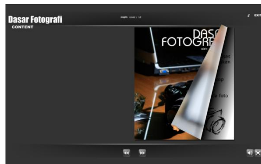
Gambar 3. Dasar Fotografi

Pada halaman dasar fotografi berisi tentang teori dasar fotografi. Pada halaman ini, materi yang disajikan dalam bentuk flipbook atau majalah digital. Tampilan halaman dasar fotografi ditunjukkan pada Gambar 3.