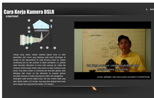
Gambar 6. Cara Kerja Kamera DSLR

Halaman ini berisi tentang penjelasan cara kerja kamera DSLR di sebelah kiri dan video tentang cara kerja kamera DSLR di sebelah kanan. Video ini juga dilengkapi dengan subtitle. Halaman Cara Kerja Kamera DSLR ditunjukkan pada Gambar 6.