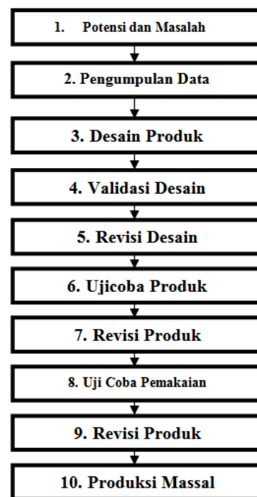
Gambar 1. Langkah-langkah Pengembangan Produk (Sugiyono, 2011: 298)

Penelitian ini menggunakan rancangan penelitian pengembangan. Penelitian dan pengembangan ( Research and Development ) adalah metode penelitian yang digunakan untuk menghasilkan dan menguji keefektifan suatu produk tertentu (Sugiyono, 2008:298). Penelitian dan pengembangan ini memiliki langkah-langkah seperti yang ditunjukkan pada Gambar 1.