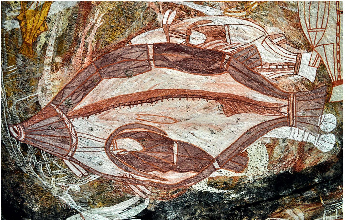
Fig. 1. a. Nawarla Gabarnmang showing extensively painted roof. Note the staggered ceiling levels indicating sheet-collapse layers of rock strata from the ceiling. Some of these collapsed layers of rock now lie horizontally buried below ground; others were removed to the site's northern and southern talus slopes by people in the past. b. Detail of the painted ceiling.