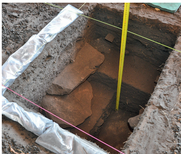
Fig. 3. Nawarla Gabarnmang, fouille en cours des carrés E et J montrant la présence de grandes dalles horizontales enterrées tombées du plafond. Elles ont scellé des niveaux sédimentaires sous-jacents et limité les déplacements postérieurs de matériaux.