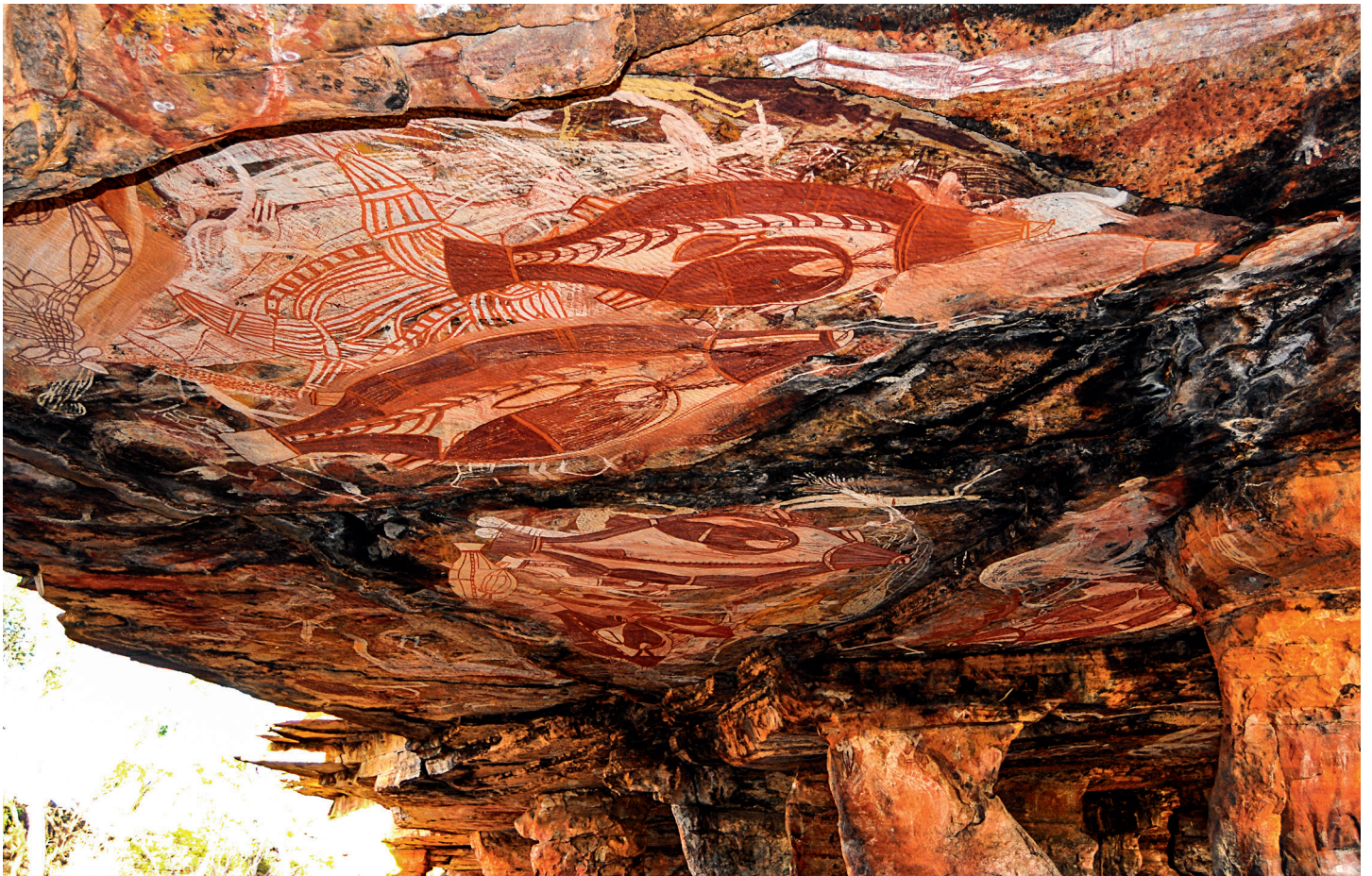
Fig. 1. a. Abri de Nawarla Gabarnmang au plafond abondamment décoré. Notez les niveaux distincts de la voûte témoignant de décrochages horizontaux de la roche. Certains se trouvent enterrés à l'horizontale sous le sol ; d'autres ont été déplacés dans le passé, par les gens, sur les talus au sud et au nord. b. Détail du plafond peint.