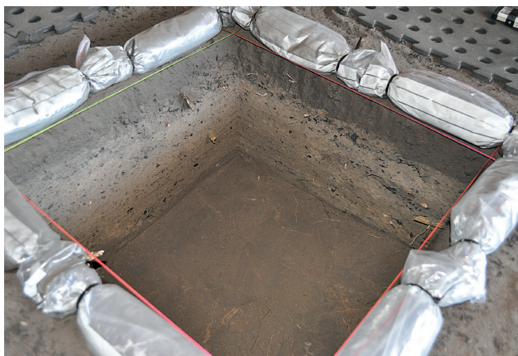
Fig. 4. Nawarla Gabarnmang, Carré P, parois sud et ouest après fouille. La base du carré est occupée par une roche plate horizontale. Ce n'est pas la bedrock mais la surface supérieure d'une partie effondrée de la voûte.