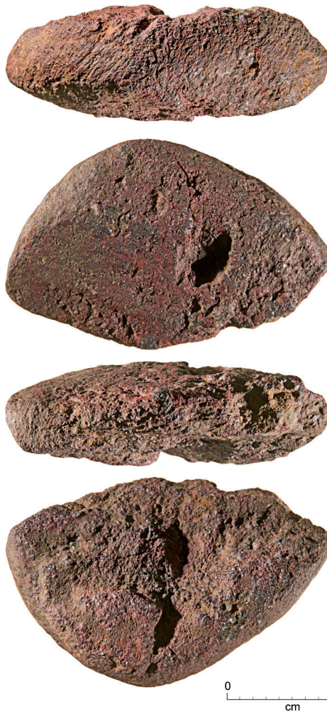
Fig. 6. Crayon d'ocre de Nawarla Gabarnmang, Carré A XU26, avec facettes et stries d'usure. Il est encadré par des dates radiocarbone de 12\,746 \pm 43 BP (Wk-28620) et 17\,833 \pm 77 BP (Wk-30468) et il apporte la preuve de l'exécution d'un art pléistocène dans la période 15 029-21 857 cal BP.

centimètres de sédiment (fig. 4). Les surfaces actuelles de la voûte juste au-dessus de ces niveaux de roches tabulaires portent de nombreuses peintures (fig. 5). L'une des priorités de notre recherche de terrain future est de fouiller certaines de ces grandes roches pour voir si elles sont décorées à la base. En outre, dans un certain nombre des carrés fouillés, nous avons mis au jour des crayons en ocre pléistocènes utilisés, porteurs de facettes et de stries d'usure (fig. 6). Nous publierons ces résultats le moment venu.