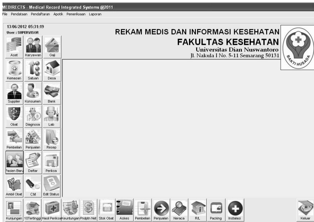
Gambar 1. Menu Utama

Tabel database pasien disimpan dalam tabel konsumen (pasien umum dan mahasiswa serta karyawan UDINUS) digunakan untuk menampung data pasien termasuk mahasiswa keseluruhan yang ada. Dalam rancang bangun ini, sistem sudah disiapkan untuk terintegrasi dengan tabel data mahasiswa. Sehingga validitas data akan