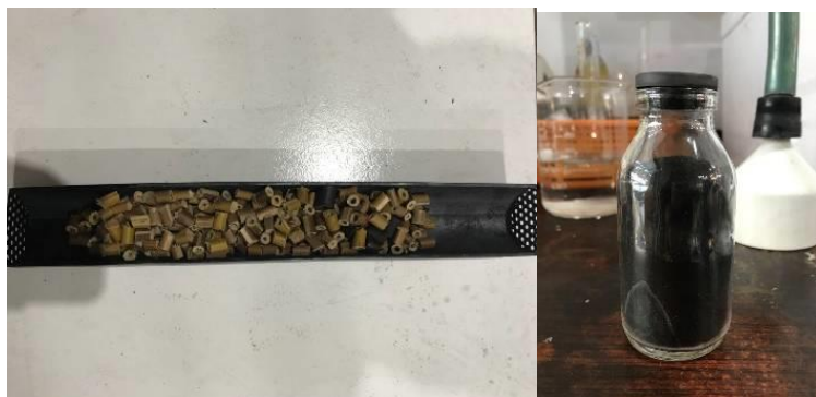
Gambar 1. Bambu ori yang telah dipotong 2-3 cm (kiri), serta karbon sebagai bahan katalis yang dihasilkan (kanan)

Proses penyiapan katalis karbon adalah melakukan karbonisasi pada ranting bambu ori (diambil dari Hutan Kota di Keputih, Surabaya) pada suhu 773 K selama 2 jam. Aktivasi dan fungsionalisasi dilakukan dengan merendam material karbon dalam H_3PO_4 dan HNO_3 secara berurutan. Gambar 1 menunjukkan transformasi bahan ranting bambu yang kemudian dipakai sebagai katalis karbon ( carbon catalyst ).