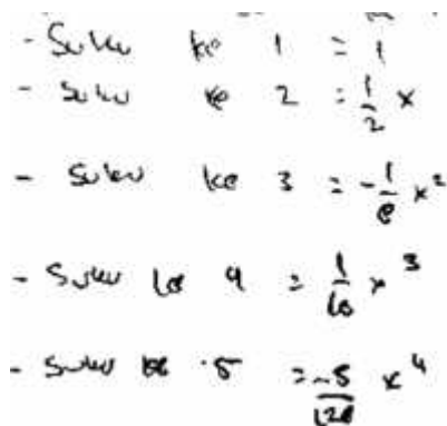
Gambar 3 Perbaikan kesalahan jawaban pertanyaan pertama

Dari aktivitas wawancara, tersebut kemudian MR menunjukkan hasil perbaikannya yang sesuai dengan struktur berfikir soal. Adapun perbaikan jawaban yang dimaksud dapat diamati pada gambar 3