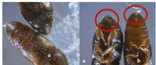
Gambar 6. Perbedaan bentuk badomen pada jantan (a) dan betina (b) pada perbesaran 100-200x