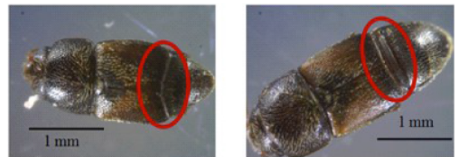
Gambar 5. Imago C. dimidiatus (1). Jantan, (2) betina

Imago jantan dan betina dapat dibedakan dari ujung abdomennya, pada imago jantan apabila dilihat dari bagian ventral nampak datar sedangkan pada imago betina pada ujung abdomennya nampak seperti ovipositor. Pada punggung bagian bawah, terdapat lingkaran seperti cincin pada imago betina, sedangkan pada imago jantan bentuk ujung elitra sedikit diagonal (Gambar 6).