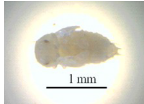
Gambar 4. Pupa C. dimidiatus pada perbesaran 100-200x

ditumbuhi bulu seperti duri. Bentuk mata terlihat, warna pupa putih dan semakin kekuningan saat akan keluar imagonya. Pupa biasanya berada di dalam biji, ada pula yang di luar jika biji sudah benar-benar menjadi serbuk.