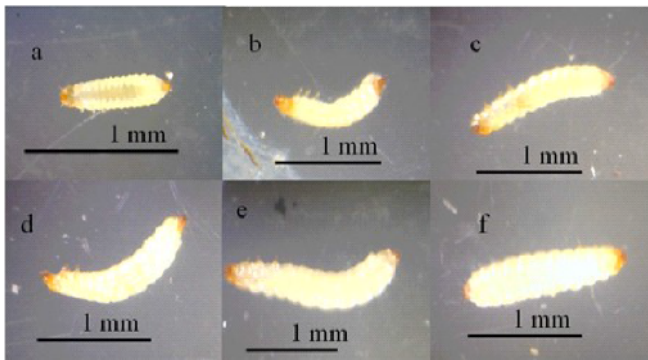
Gambar 3. Larva C. dimidiatus pada perbesaran 100-200x. (a) instar 1, (b) instar 2, (c) instar 3, (d) instar 4, (e) instar 5, (f) instar 6

Larva terdiri dari 6 instar. Instar ke-I yang berukuran sekitar 0,8-0,9 mm (Gambar 4. a), fase ini berlangsung selama 3-4 hari. Pada fase instar ke-II panjang tubuh 1,1-1,2 mm (Gambar 4.b.), instar ke-III panjang tubuh 1,3-1,4 mm (Gambar 4.c), instar ke IV panjang tubuh 1,4-1,8 (Gambar 4.d), hingga instar V tidak terjadi perubahan warna dan struktur tubuh dengan panjang tubuh 1,8-2,2 mm (Gambar 4.e). Pada instar VI tubuhnya menggemuk dan memendek sekitar 1,5-1,6 mm (Gambar 4.f).