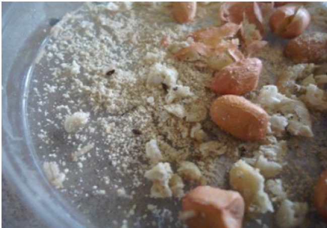
Gambar 7. Gejala serangan C. dimidiatus pada kacang tanah

Tidak semua bagian biji dimakan oleh C. dimidiatus . Imago C. dimidiatus membuat lubang pada kacang lalu memakan bagian dalam kacang, begitu pula larva memakan bagian dalam kacang, terkadang bersembunyi didalamnya hingga membentuk pupa, bagian kulitnya selalu disisakan, sehingga apabila dilihat dari luar masih tampak utuh, ketika dibuka bagian dalamnya terdapat serbuk kotoran. Aktivitas makan yang dilakukan menghasilkan kotoran berbentuk serbuk yang tercampur dengan kacang (Gambar 7).