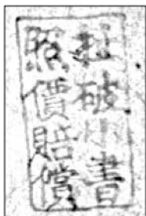
(左) 図3 貸本屋のオキテを明記した印章 ★筆者架蔵『積みわらの中の拳銃』（『草堆裏的槍』、1964）に押された印

一九五八年のある連環画には、「天津市租書公司」なる貸本屋の印とともに「半分」すなわち〇・五分と押されている〔図7〕。「二分」にくらべると、四分の一である。地域や時代、店によっても価格の差はあったに相違ない。