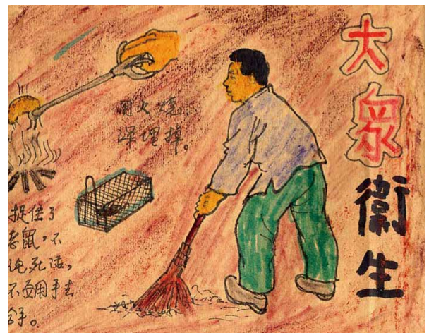
図1 お手製の表紙——『簡要大衆衛生』（1952） ★筆者所蔵『簡要大衆衛生』（勞懋傳醫師編、王井絵図。群生書店・連聯書店、1952）

た本体のほうは店内に保管されている。子どもたちが、表紙を見て読みたい作品を選び、店主に伝えると、本体が出てくるというシステムである。これは、タバコ、CDやDVDを売るような小さな店舗での販売方法と類似している。さらに絵心のある店主の筆によるものと思われるが、自作の表紙絵が描かれていたり〔図1〕、あるいは別の印刷物——たとえば『連環画報』掲載連環画の一コマなど——の図像を貼り付けているケースもあった。