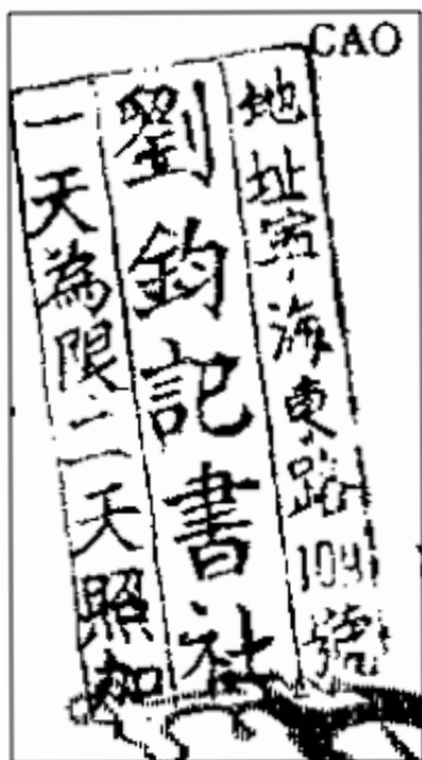
図2 「劉鈞記書社」の印章 ★筆者架蔵『草堆裏的槍』（嚴兵原著、胡映西改編、葉堅銘繪画。浙江人民出版社、1964）に押された印

109 號・劉鈞記書社・一天為限 一天照加」とある印章〔図2〕には、商号とその住所だけでなく、「（貸出期間は）一日とし、二日にわたったら賃料は倍加する」という、貸出の規則が明示されている。また「扯破小書・照價賠償（小人書を破損したら、価格に照らして弁償すべし）」とある印章〔図3〕や、「次日帰還、隔日加倍。塗改揭碎、照價賠償」（翌日に返却すべし、一泊したら料金は二倍。落書きや破損があれば、価格に照らして弁償すべし）とあるもの〔図4〕は、商品を大切にしてほしいとの、店主からの切なるお願いが伝わってくる。本質的には、今日のレンタルビデオ屋とあまり変わらない規則があったことがうかがえよう。