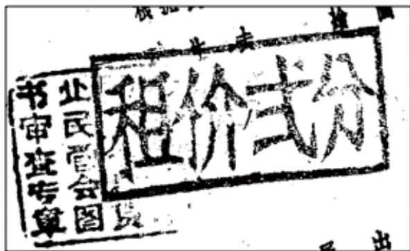
図6 貸し賃を明記した印章 ★筆者架蔵『義俠撩天』（根拠閩南民間故事改編、顧生夫繪画。福建人民出版社、1960）に押された印