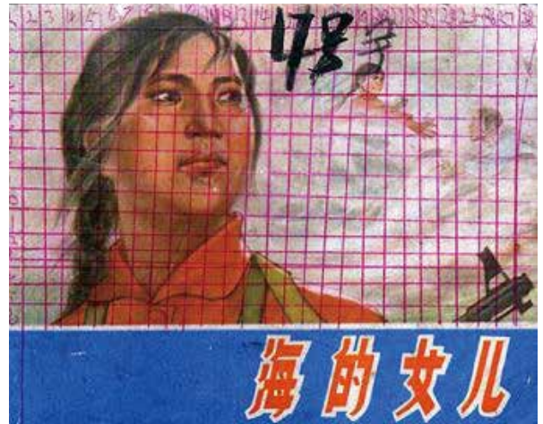
図8 グリッドが描きこまれた表紙 ★筆者架蔵『海的女儿』（傅彤原著、張曉冰改編、瞿谷寒（南匯県文化館）絵画。上海人民出版社、1975）印

連環画は、まずは表紙に描かれた表紙絵という、第一の〈顔〉を持って印刷所から世に送られる。この顔は、出版部数だけ同じものが存在する。印刷物として世に出