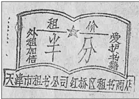
図7 貸し賃を明記した印章 ★筆者架蔵『小鴨江辺の紅旗』（蘇敦勇改編、裴家同絵画。安徽人民出版社、1958）に押された印

この印章には、左右に縦書きで、「外租加倍」「愛護書籍」の八字が付されている。連環画を、店の前に腰をおろして読むのであれば「半分」だが、「外租」つまりテイクアウトの場合は二倍になるということである。それぞれの時期の物価指数と、貸本屋の印章のメッセージをさらに詳細に調査することで、貸本連環画をめぐる読書世界がすこしずつ見えてくるだろう。