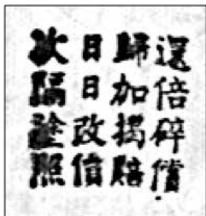
(右) 図4 貸本屋のオキテを明記した印章 ★筆者架蔵『伊倫娜，回家去！』（電影連環画冊）（文飄改編。中国電影出版社、1957）に押された印