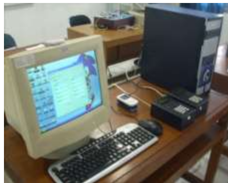
Gambar 2. Hasil Perancangan Alat Anjungan Transaksi Pulsa Elektronik Mandiri (ATPEM)

Gambar 2 menunjukkan beberapa hardware yang digunakan dalam sistem anjungan transaksi pulsa elektronik mandiri, yaitu :