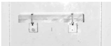
Figure 4. Photograph of Plexiglas support with small marble strips.