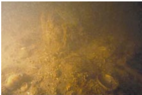
Figura 2. Foto di reperti ceramici rinvenuti sul fondale lagunare.

I fenomeni di degrado dei reperti lignei sono risultati essere l'idrolisi della cellulosa, il degrado strutturale dovuto all'azione meccanica dell'acqua e principalmente l'attacco ad opera di organismi marini xilofagi. Tutte queste forme di degrado avvengono in ambiente aerobico,