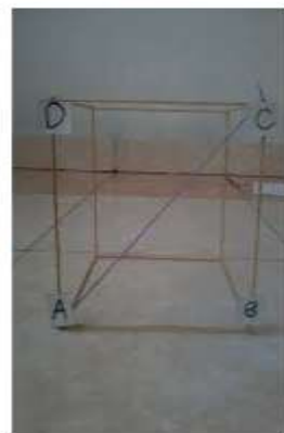
Gambar 2. Penggunaan Alat Peraga menghitung jarak antara titik A ke titik C

Terlihat dengan menggunakan alat peraga tersebut siswa kesulitan dalam memvisualisasikan dan melakukan perhitungan jarak antara titik A ke titik C. Dengan pembelajaran software cabri 3D siswa dimudahkan dengan membuat sketsa gambar bangun ruang sesuai dengan ukuran yang diinginkan. Seperti terlihat pada gambar 3 berikut.