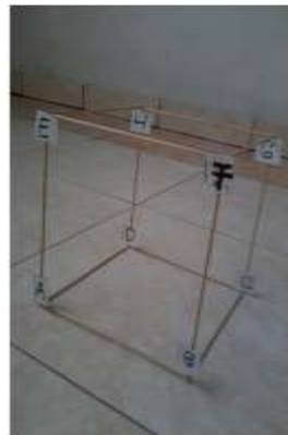
Gambar 1. Alat Peraga Kerangka Besi Bangun Ruang Kubus ABCD.EFGH

Kemampuan visualisasi spasial dengan menggunakan software cabri 3D dapat dilihat bagaimana awalnya siswa terbiasa menggunakan papan tulis/whiteboard untuk menggambar bangun ruang ataupun penggunaan alat peraga seperti kerangka kubus dan bangun ruang lainnya yang terbuat dari kerangka besi. Seperti halnya pada subpokok bahasan jarak dengan menggunakan alat peraga maka untuk menentukan garis hanya dengan menggunakan benang seperti yang ada pada gambar dibawah ini.