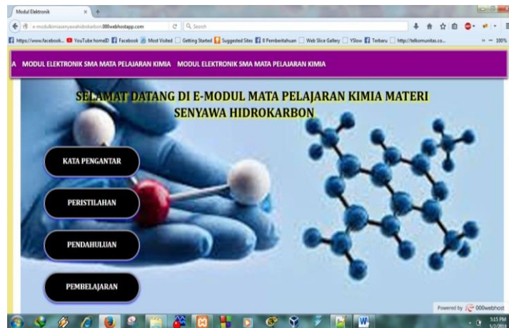
Gambar 3. Implementasi Halaman Utama

Pembuatan e-modul ini dalam tahap pengkodean menggunakan Notepad++ dan untuk mengakses database di PhpMyAdmin menggunakan XAMPP Control Panel V3.2.1. Berikut implementasi coding di Notepad++ beserta tampilan akhir e-modul berbasis web. Gambar 3 berikut ini adalah hasil implementasi coding menggunakan Notepad++ dan user interface halaman utama untuk media pembelajaran e-modul kontekstual interaktif berbasis pada mata pelajaran kimia materi senyawa hidrokarbon.