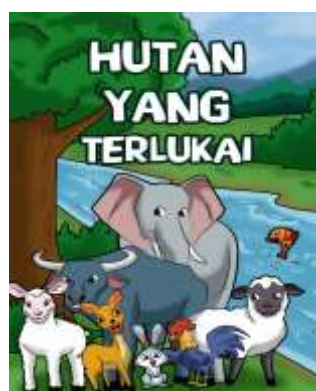
Gambar 1. Tokoh dalam komik

Komik fabel menggunakan tokoh binatang yang terkenal dikalangan siswa atau anak – anak. Tokoh yang sering muncul di televisi yang menarik untuk siswa untuk membaca.