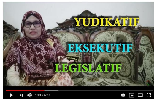
Gambar 2. Salah satu contoh video ajar yang telah diunggah pada laman YouTube ( https://www.youtube.com/watch?v=y2mNKGhBHF&t=44s )

Langkah kedua adalah mengunggah atau mentransfer video ajar ke laman YouTube. Dalam penelitian ini, pengajar mulai membuat akun YouTube dan mengundang siswa untuk mengakses laman tersebut sekaligus mensubscribe channel tersebut. Gambar 2 dan 3 berikut ini menunjukkan contoh konten yang telah ditransfer ke laman YouTube.