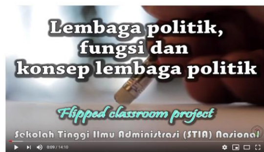
Gambar 3. Salah satu contoh video ajar yang telah diunggah pada laman YouTube ( https://www.youtube.com/watch?v=_ekdWxQOB_I )