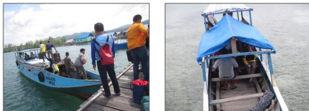
Gambar 2. Akses kapal nelayan yang digunakan pengunjung dari Langgapulu (kiri) dan Desa Namu, Dusun 2 (kanan)