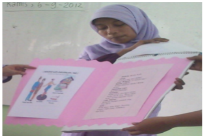
Gambar 2. Kalender Nusantara

b. Kalender Nusantara; terbuat dari kalender bekas yang dimanfaatkan untuk menempelkan gambar-gambar tentang kekayaan Nusantara, yaitu pakaian adat, rumah adat, tari adat, dan senjata. Media ini mengembangkan kognitif siswa. Penggunaannya untuk memberikan pemahaman terkait budaya dan tradisi yang terdapat di seluruh Nusantara.