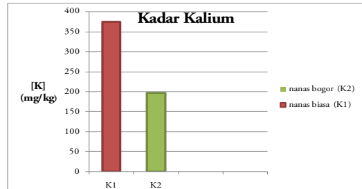
Gambar 2. Diagram perbandingan kadar K nanas biasa dan nanas Bogor.

menggunakan alat fotometer nyala (Sumardi, 1998) . Sehingga di dapatkan konsentrasi kalium untuk nanas biasa sebesar 376 mg/kg. Sementara pada nanas bogor terdapat 198 mg/kg kalium, dengan faktor pengenceran 100 kali.